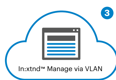
Konfigurera och övervaka via In:xtn™ Manage